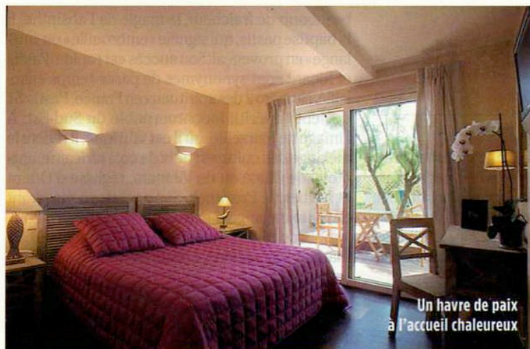
Un havre de paix à l'accueil chaleureux