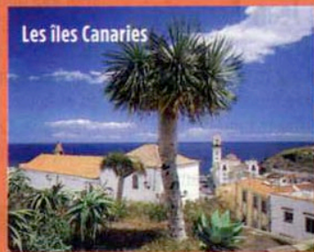
Les îles Canaries

Aéroports de Paris a publié les chiffres du trafic international de juillet : nous savons où vous avez passé vos vacances ! En nombre de départs et d'arrivées cumulés, ce sont l'Espagne et les îles Canaries qui gagnent, avec 661 988 passagers. C'est la plus belle progression du classement, +21,3 % par rapport à juillet 2006. Suivent les États-Unis, l'Italie, le Royaume-Uni et l'Allemagne. Autre belle croissance, en 6 e position, le Maroc, avec +17,6 %. Les 7 e et 8 e places sont occupées par la Tunisie et les Antilles et, en 9 e position, le Canada confirme sa percée