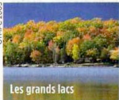
Les grands lacs

Avec JetSet équinoxiales, un circuit au cœur de l'Ontario, entre lacs et rivières. Chutes du Niagara,